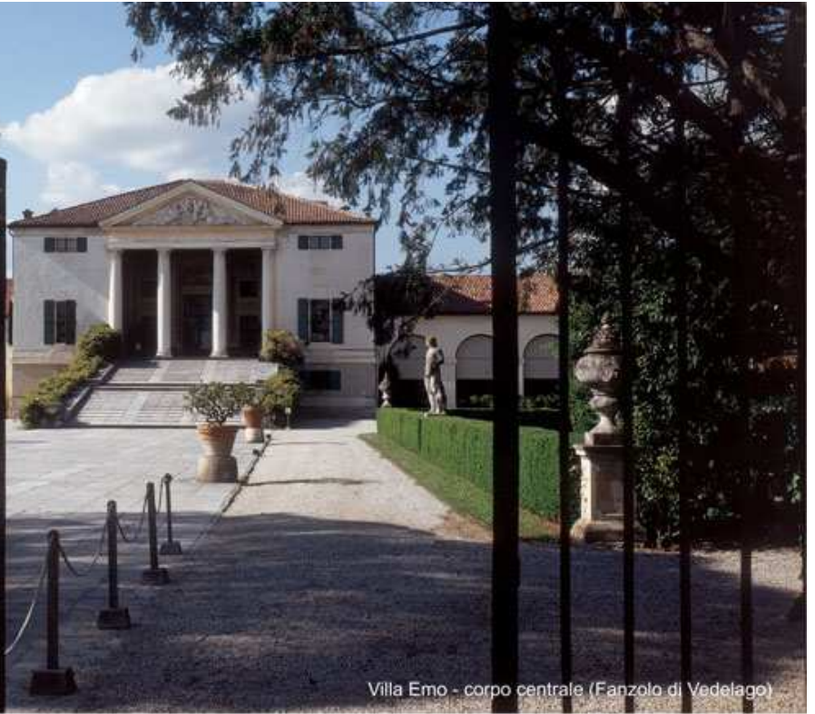
Villa Emo - corpo centrale (Fanzolo di Veduggio)

Ville, palazzi, edifici religiosi, opifici e borghi costituiscono un patrimonio culturale, storico ed artistico in attesa di rivelarsi. Otto periodi storici creano il pretesto per un percorso a tappe finalizzato alla riscoperta e all'approfondimento del nostro patrimonio architettonico. Nell'area ricompresa tra la Pedemontana del Grappa e Castelfranco Veneto, si trova una collana di capolavori architettonici noti a livello internazionale, che rendono conto di oltre 1000 anni di storia.