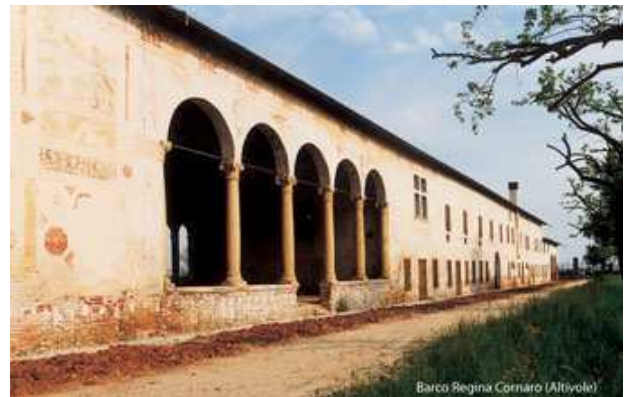
Barco Regina Cornaro (Altivole)

"Fu... in una spaziosa campagna dell'Asolano fabbricato un Barco, lungo per ogni parte mezzo miglio, serrato d'una continuata muraglia". Luogo di delizia, centro agricolo e sistema difensivo, esso riuniva un insieme di architetture, logge, sale, appartamenti con stanze nobili e riscaldate, strutture idrauliche, una pescheria, una colombaia, orti e giardini... da Historia di Trevigi Giovanni Bonifacio (1547-1635)