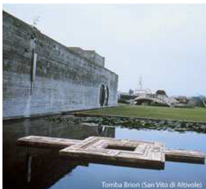
Tomba Brion (San Vito di Altivole)

o moderno, dell'acqua e della vegetazione. " Un ordinato spazio di serene e poetiche suggestioni, di memorie, di incantesimi, di intimo raccoglimento...". Carlo Scarpa è qui... semplicemente sepolto, in piedi secondo le sue volontà, in un angolo nascosto del recinto. da Marca Nobilissima, La Provincia di Treviso Paolo Marton 1994