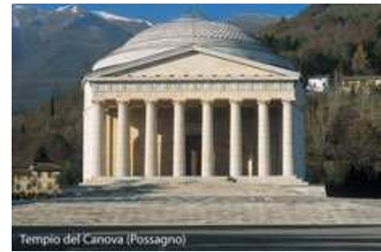
Tempio del Canova (Possagno)