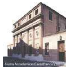
Teatro Accademico (Castellfranco Veneto)

"Una fusione ideale di due archetipi dell'architettura classica greco-romana: il pronao dorico del Partenone e il corpo circolare a cupola emisferica del Pantheon... un simbolo senza tempo, isolato, ingigantito e proiettato nello spazio vastissimo della valle, in un continuo confronto con monti e colli... dialogo tra titani della natura e del genio umano...". da Marca Nobilissima, La Provincia di Treviso Andrea Bellieni 1994.