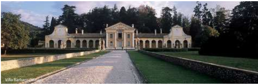
Villa Barbaro (Maserano)