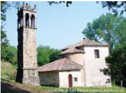
Oratorio di San Bartolomeo (Castelcucco)

Con la sua struttura semplice a pianta rettangolare, il tetto a capriate e l'abside semicircolare, il piccolo oratorio di San Bartolomeo, situato