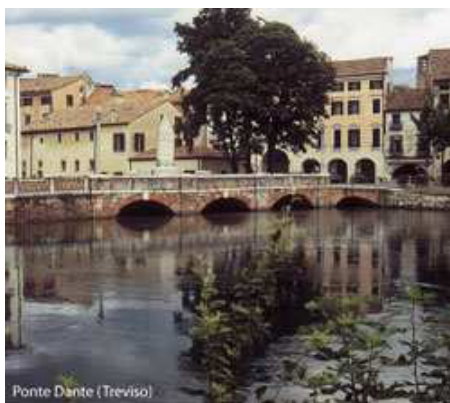
Ponte Dante (Treviso)