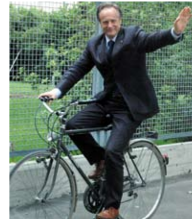
Il Sindaco della Città di Oderzo avv. Pietro Dalla Libera

Anche quest’anno, allora, auguro agli amati Cittadini di Oderzo e ai graditi Ospiti, di assaporare, con amici e familiari, una parentesi distensiva tra i mille impegni che la vita e i suoi ritmi oggi ci impongono.